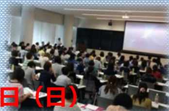
2017年度の講習会の様子