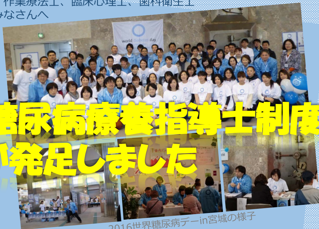
2016世界糖尿病デーin宮城の様子

看護師、准看護師、保健師、助産師、管理栄養士、栄養士、薬剤師、臨床検査技師、理学療法士、作業療法士、臨床心理士、歯科衛生士の資格を持つ医療従事者のみなさんへ